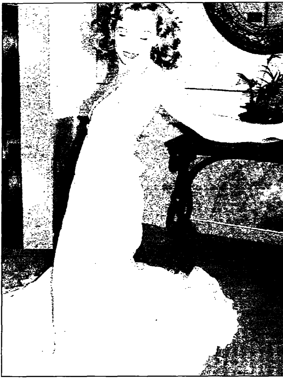
كريستين سكوت توماس

استنوبل - من سونا ايردم عن صناعة السينما يعتقد بيتر غرينواي ان العالم لم ير شيئا يكره حتى الآن.